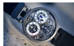
Portée pour vous: La Bovet Pininfarina OttantaSei 10- Day Flying Tourbillon