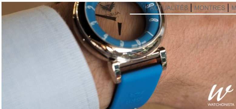
Ali & Co Mysterali

Ali soupira. «Il me semble que vous pourriez mieux employer le temps et ne pas le gaspiller à proposer des énigmes qui n'ont point de réponses.»