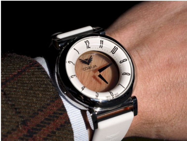
Ali & Co Mysterali

De face, elle est plutôt sage avec son affichage analogique si ce n'est l'aiguille des minutes qui reprend la couleur des index. De dos, Alicious est plus originale avec une flèche qui pointe les heures alors que les minutes apparaissent dans un guichet à 6 heures.