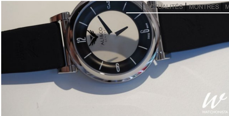
Ali & Co Mysterali

En connexion avec la tradition historique des montres et horloges mystérieuses, Mysterali se porte à l'endroit mais se lit à l'envers, aussi. Recto, 1, 2, 3... les chiffres et les aiguilles suivent leur cours normal. Verso, 12, 11, 10... tout est inversé; Mysterali semble remonter la marche du temps mais pourtant indique la même heure.